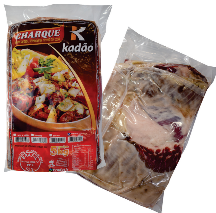
Ponta de Peito (2 pelos) 5kg

Sua durabilidade em temperatura ambiente é de 3 a 4 meses aproximadamente.