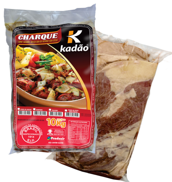
Ponta de Peito (2 pelos) 10kg