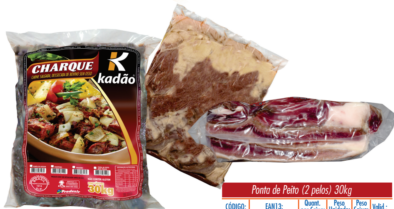
Ponta de Peito (2 pelos) 30kg