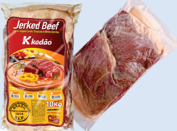
Ponta de Peito (2 Pelos) 10kg