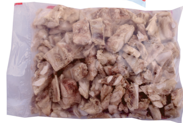
Costelinha Rojão 5kg